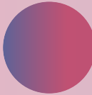
Emilio Palomo Balda Magistrado del TSJ de Andalucía (Sevilla)